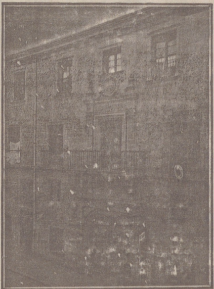
Entrada a las Oficinas de la Federación y MUTUALIDAD AGRÍCOLA BURGALESA. Calle de Santander, números 10, 12 y 14. Burgos.

En ella están las Oficinas de la FEDERACIÓN, CAJA DE AHORROS, MUTUALIDAD AGRÍCOLA BURGALESA y Redacción y Administración de «El Castellano» y «El Defensor de los Labradores»