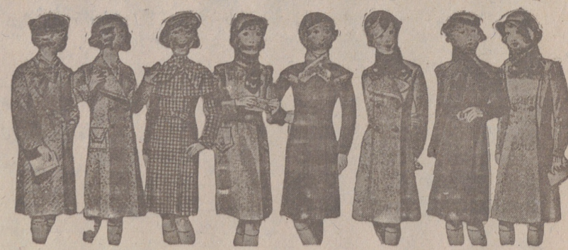
ABRIGOS PARA NIÑAS — MODELOS NOVEDAD, de 15, 18, 20, 25, 30 y 40 pesetas.

Primera casa en confecciones para caballero, señora, jóvenes y niños. — Tejidos, Pañería y Sastrería.