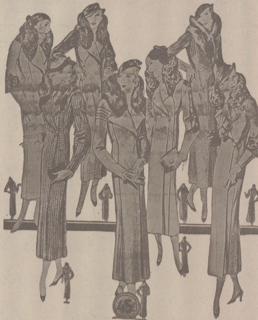
50 Modelos distintos en Abrigos Gamuzas NOVEDAD.—Modelos, creación Parísien a 25, 50, 40, 50, 60, 70, 80 y 100 pesetas