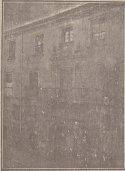
Entrada a las Oficinas de la Federación y MUTUALIDAD AGRÍCOLA BURGALESA. Calle de Santander, números 10, 12 y 14. Burgos.

Un accidente en vuestros obreros, criados, pastores o en vosotros mismos, puede causar grave daño económico o la ruina en vuestra casa.