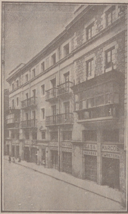
Fachada, por la calle de la Moneda, números 16 y 17, de la CASA SOCIAL propiedad de la Federación Burgalesa de Sindicatos Agrícolas Católicos.

Un accidente en vuestros obreros, criados, pastores o en vosotros mismos, puede causar grave daño económico o la ruina en vuestra casa.