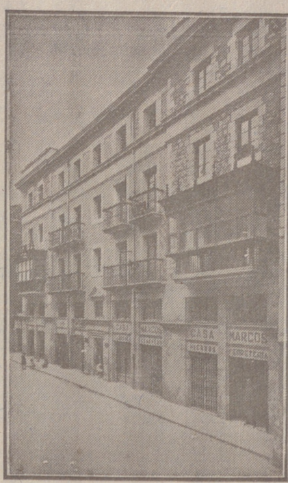
Fachada, por la calle de la Moneda, números 15 y 17, de la CASA SOCIAL propiedad de la Federación Burgalesa de Sindicatos Agrícolas Católicos.

Se hallan establecidas en su planta baja las Oficinas y talleres de máquinas de «El Castellano» y «El Defensor de los Labradores»