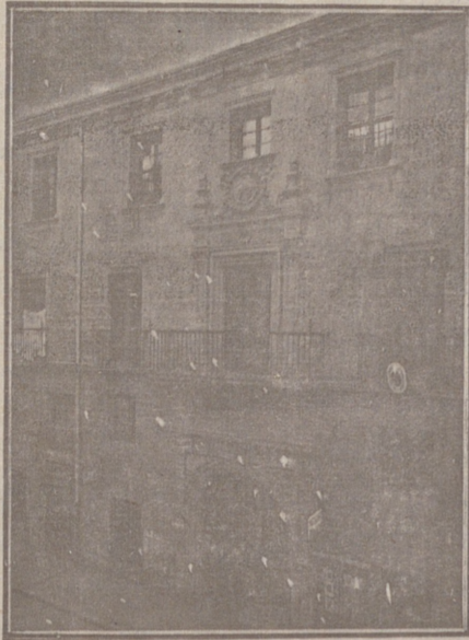
Entrada a las Oficinas de la Federación y MUTUALIDAD AGRÍCOLA BURGALESA. Calle de Santander, números 10, 12 y 14. Burgos.

Un accidente en vuestros obreros, criados, pastores o en vosotros mismos, puede causar grave daño económico o la ruina en vuestra casa.