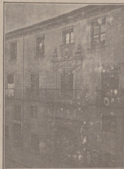
Entrada a las Oficinas de la Federación y MUTUALIDAD AGRICOLA BURGALESA Calle de Santander, números 10, 12 y 14 Burgos