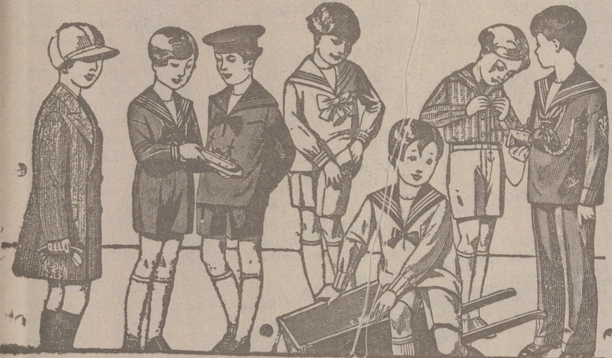
50 modelos distintos en trajes para niños en drill, en pana, en paño y en jergas azules, de 10 a 40 pesetas.

Primera casa en confecciones para caballero, señora, jóvenes y niños. — Tejidos, Pañería y Sastrefía.