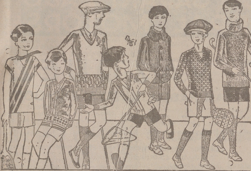
Jerseys para niños, dibujos novedad, desde 4, 4,50 5, 6, 7, 8, 10 y 12 ptas. Siempre gran surtido para elegir