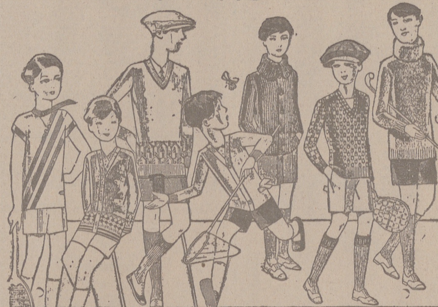
Jerseys para niños, dibujos novedad, desde 4, 4,50 5, 6, 7, 8, 10 y 12, ptas. Siempre gran surtido para elegir