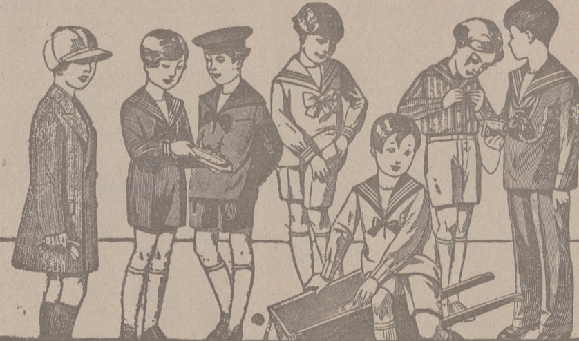
50 modelos distintos en trajectos para niños en dril, en pana, en paño y en jergas azules, del 10 a 40 pesetas.

Primera casa en confecciones para caballero, señora, jóvenes y niños. — Tejidos, Pañería y Sastrería.