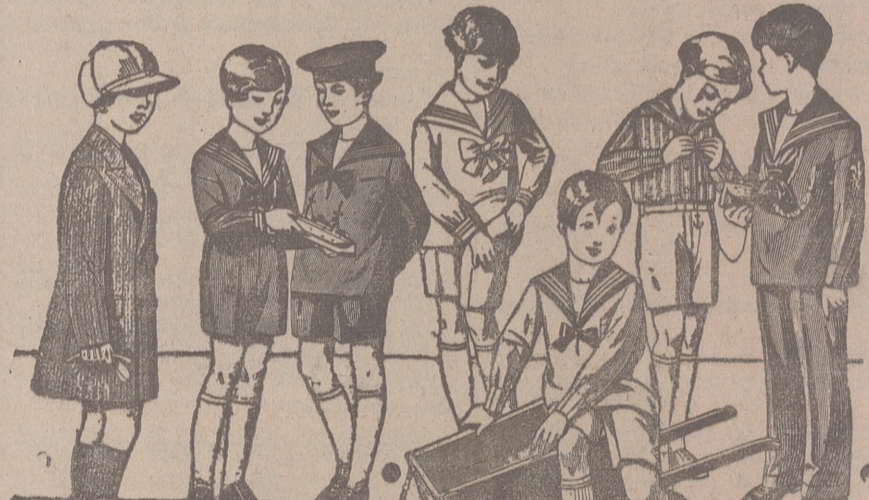
50 modelos distintos en trajes para niños en drill, en pana, en paño y en jergas azules, de 10 a 40 pesetas.

Casa Munguía :: Plaza Mayor 42 y Lain Calvo 9 Sucursal Plaza Mayor, 5 BURGOS Primera casa en confecciones para caballero, señora, jóvenes y niños. — Tejidos, Pañería y Sastrería.