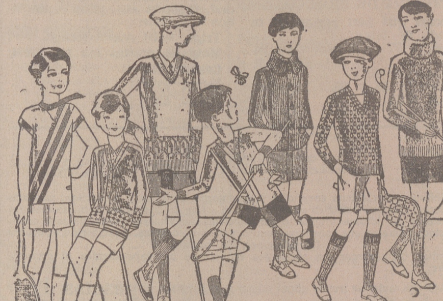
Jerseys para niños, dibujos novedad, desde 4, 4,50 5, 6, 7, 8, 10 y 12, pias. Siempre gran surtido para elegir