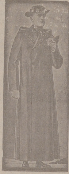
Impermeables, de 90, 100 y 115 ptas. Guardapolvos de dril forma dullela, a 18, 20, 25 y 30 ptas.