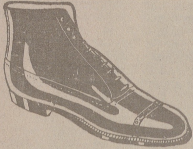
Botas clase 1.ª «Segarra», a 19'50, pesetas. Piel de hierro, a 19'50. Piel de hierro piso goma, a 18 ptas.