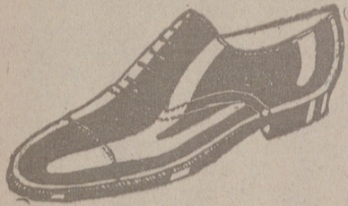
Zapatos piel de 1.ª, del 58 al 45, a 18 ptas. Zapato charol, a 19'50. LIMPIEZA GRATIS