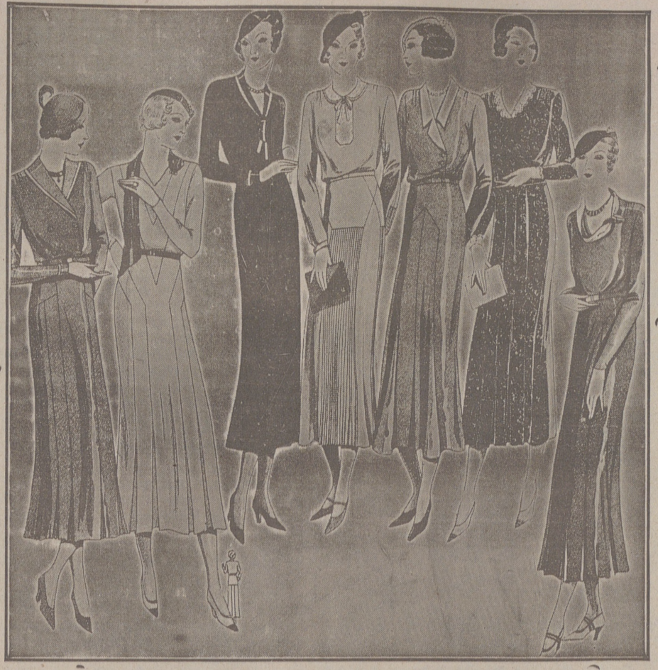
Vestidos de crespón y lana, modelos novedad, de 25, 50, 40, 50 y 60 pesetas.

Casa Munguía Plaza Mayor 42 y Lala Calvo 3 Sucursal: Plaza Mayor, 15 BURGOS Primera casa en confecciones para caballero, señora, jóvenes y niños. — Tejidos, Pañería y Sastrefía.