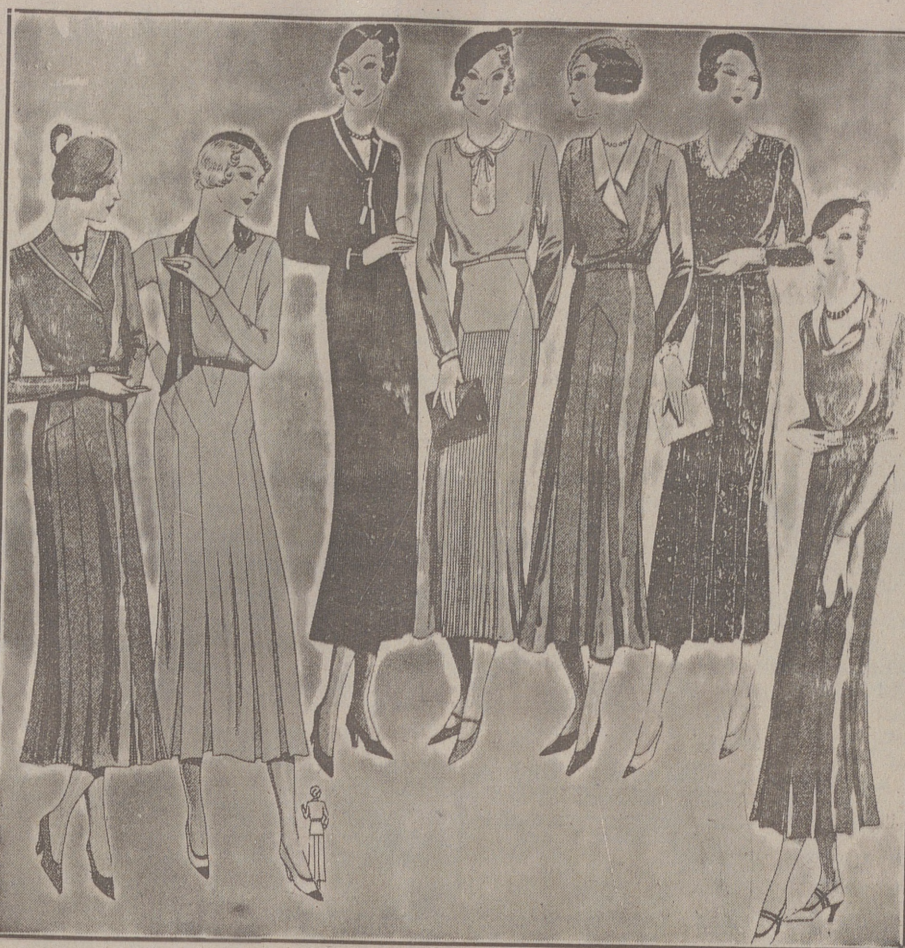
Vestidos de crespón y lana, modelos novedad, de 25, 30, 40, 50 y 60 pesetas.

Casa Munguía Plaza Mayor, 42 y Lala Calvo 9. Sucursal: Plaza Mayor, 5 BURGOS Primera casa en confecciones para caballero, señora, jóvenes y niños. — Tejidos, Pañería y Sastrería.