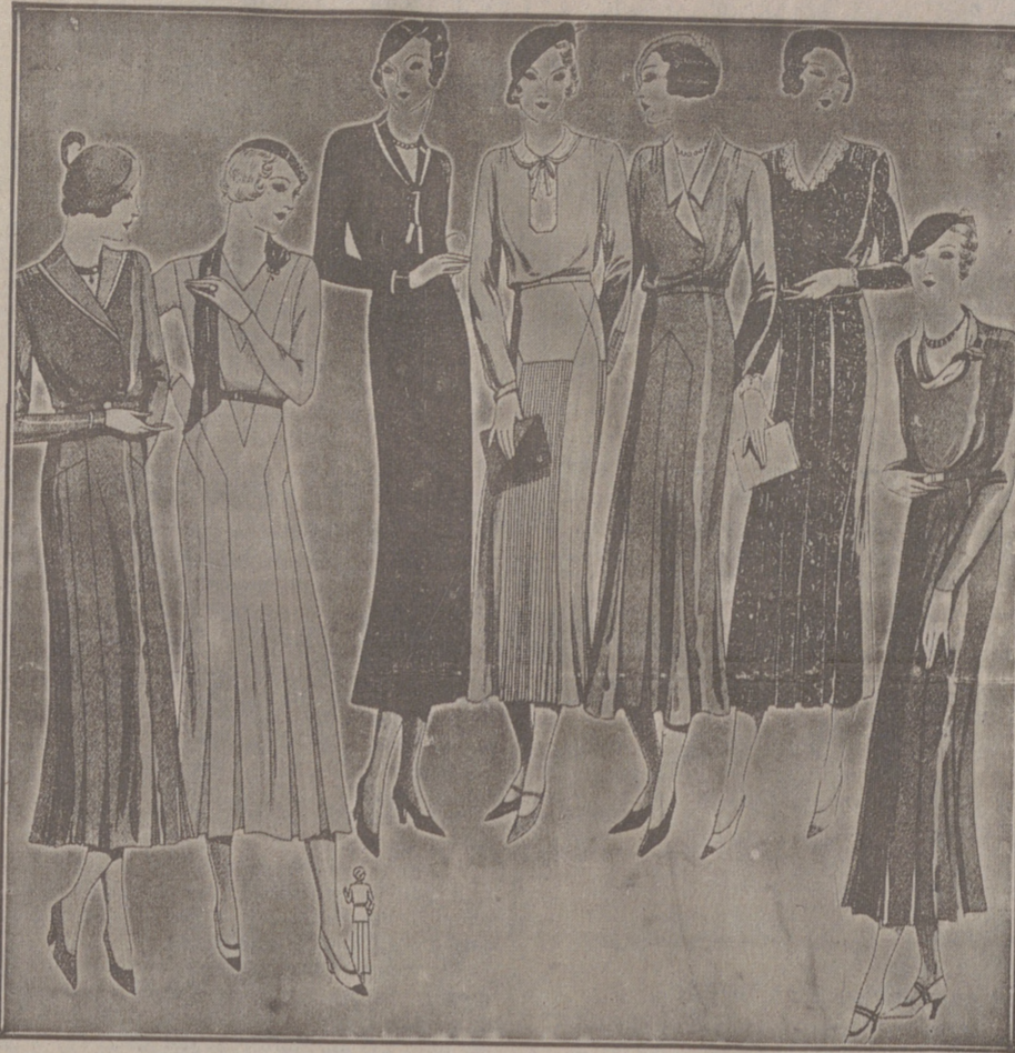
Vestidos de crespón y lana, modelos novedad, de 25, 30, 40, 50 y 60 pesetas.

Primera casa en confecciones para caballero, señora, jóvenes y niños. — Tejidos, Pañería y Sastrería.