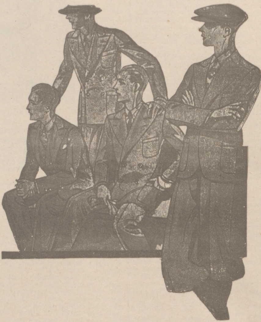
Trajes para juveniles, edad de 10 a 20 años, a 40, 45, 50, 60, y 70 pesetas

Casa Munguía Plaza Mayor, 42 Lain-Calvo, 9 y 11 BURGOS