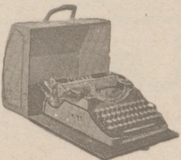
Máquinas de escribir