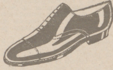
Zapatos en cinco colores distintos a 18 pesetas Zapato Charol, a 19'50

CALZADOS SEGARRA TODO COSIDO GOODYEAR Venta directa del Fabricante al consumidor