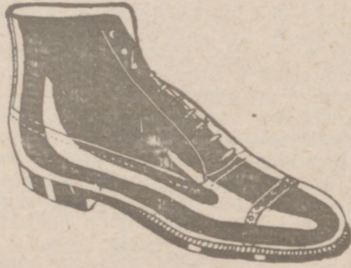
Botas en negro y color todo cosido a 19'50 pesetas

Casa Munguía PLAZA MAYOR, 42 LAIN CALVO 9 Y 11 BURGOS