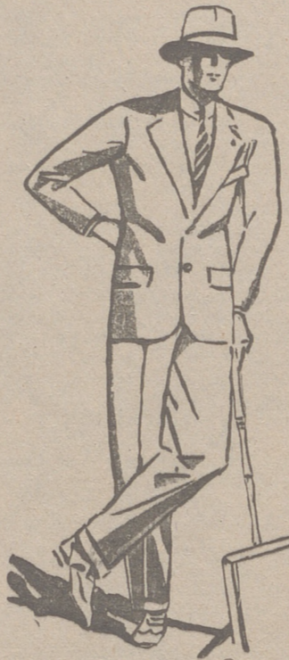
TRAJES DE PANO, CORTE MODERNO de 45 a 150 pesetas

PLAZA MAYOR, 42 LAIN CALVO 9 Y 11 BURGOS