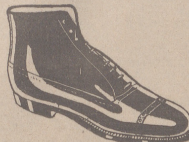
Botas en negro y color todo cosido a 19'50 pesetas EXPOSICION Y VENTA

Casa Manguía PLAZA MAYOR, 42 LAIN CALVO 9 Y 11 BURGOS