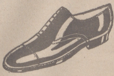
Zapatos en cinco colores distintos a 18 pesetas Zapato Charol, a 19'50

CALZADOS SEGARRA TODO COSIDO GOODYEAR Venta directa del Fabricante al consumidor