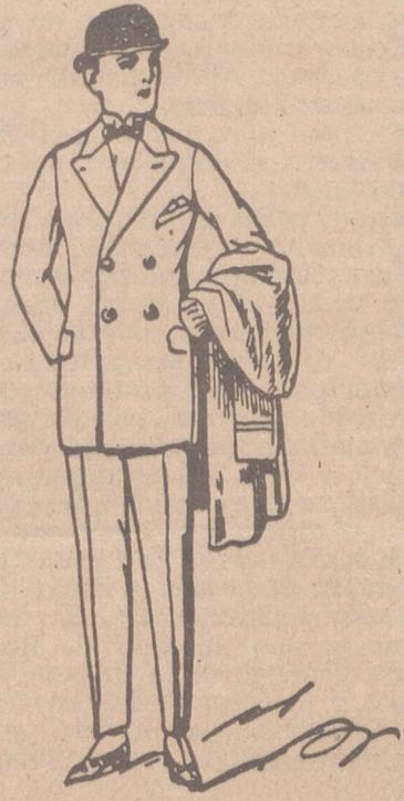
TRAJES DE PAÑO, CORTE MODERNO de 45 a 180 pesetas