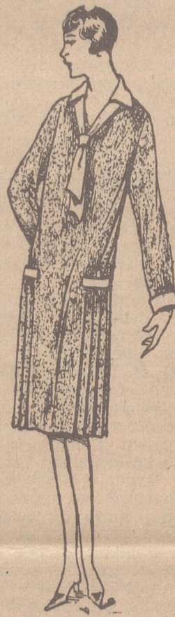
Vestidos de crepón, seda y en lana, colores novedad, a 20, 25, 30 y 40 ptas