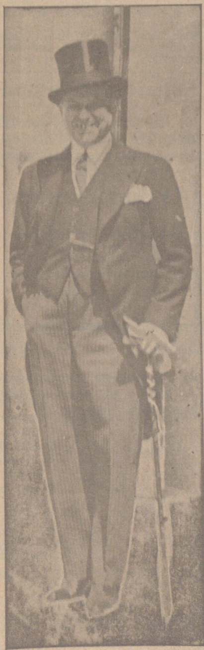
Al salir de Capitanía General posa ante el objetivo de EL CASTELLANO