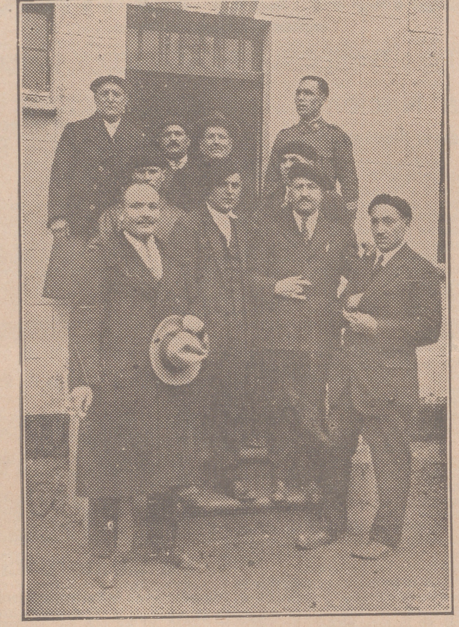
Los cooperativistas de "La Esperanza"

ducido a autoridades, padrinos e invitados. Allí vimos, esperando el principio del acto, a representaciones de la mayor parte de las Cooperativas de Casas Baratas, incluso de "La Agraria Burgense".