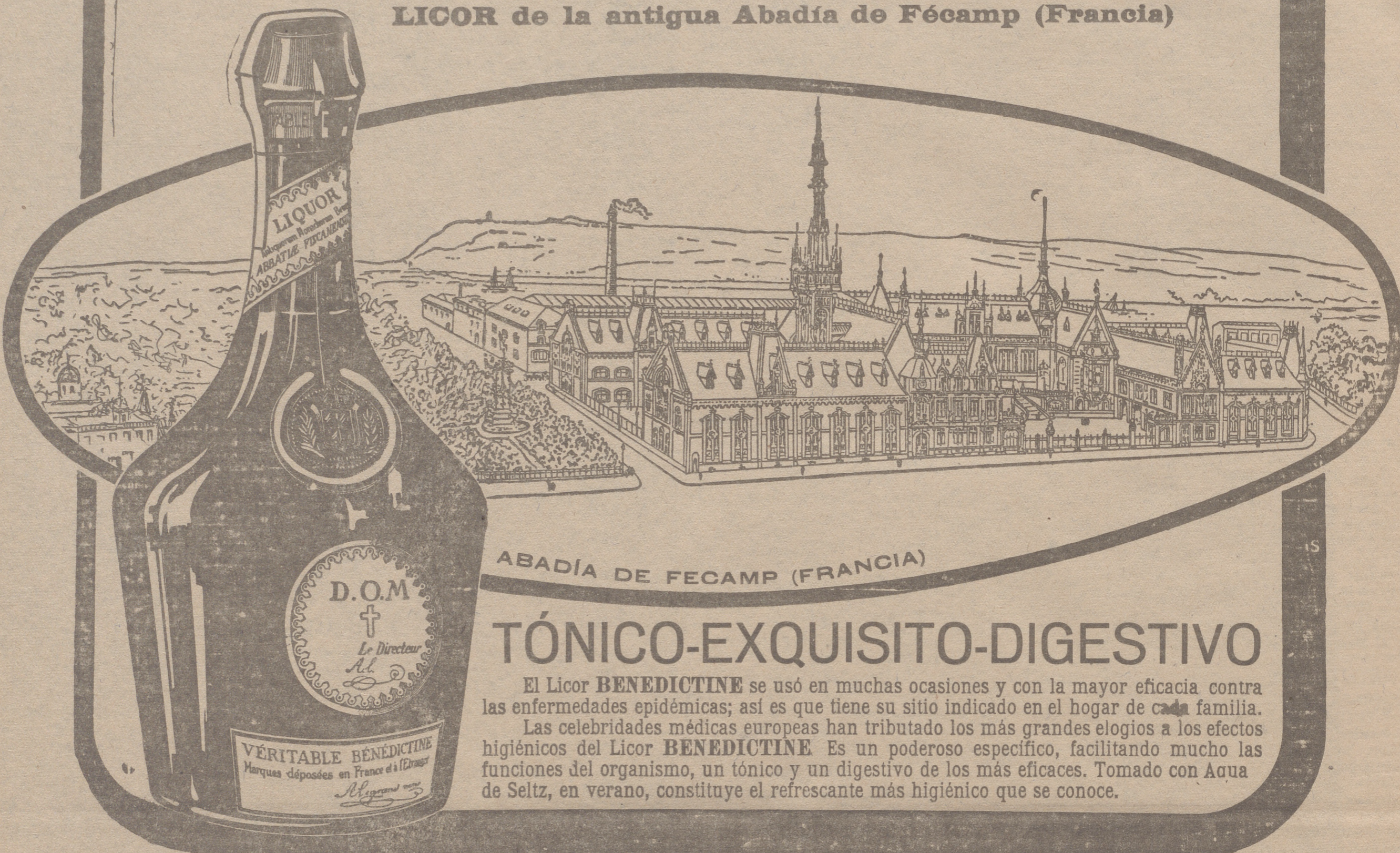
ABADÍA DE FECAMP (FRANCIA)

LICOR de la antigua Abadía de Fécamp (Francia)