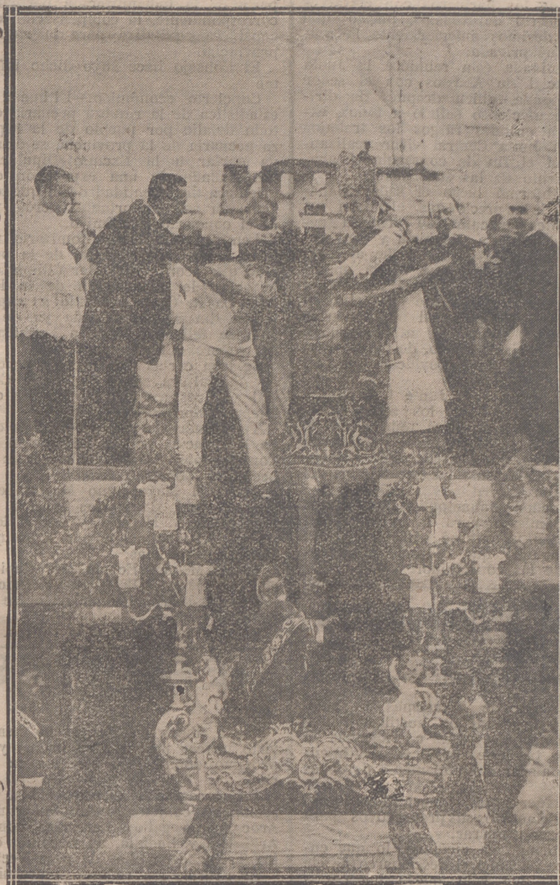
El Emmo. Carden I Benloch, Arzobispo de Burgos, en el acto de coronar al Santísimo Cristo de Paterna (Valencia)