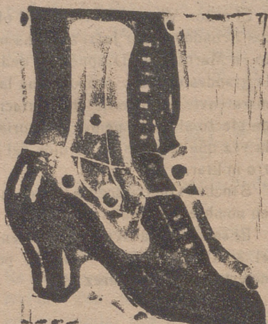
Gran surtido en todas clases, y sección económica a precios de fábrica.

MARAVILLOSAS AGUAS PARA CURAR LOS CATARROS DE LA NARIZ, LARINGE, BRONQUIOS Y PULMÓN, LA PREDISPOSICIÓN A CONTRAERLOS Y LA TISIS INSTALACIÓN MODELO • GARAJE • GIRO POSTAL • TELÉGRAFO Pidió la Guía al Administrador.