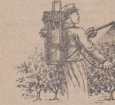
Viñedos tratados con el SULFATIZADOR LIQUIDO para combatir las.

Para ser atendido lo antes posible, sírvase enviar 40 céntimos de sellos de a 0'20 para franco del prospecto y dirigir toda la correspondencia, pedidos y consultas a «SULFATIZADOR LIQUIDO», Apartado de Correos núm. 23, LERIDA.—fabricación y Despacho: CARRETERA DE BARCELONA.