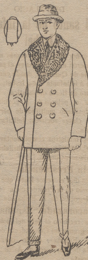
Peliza paño melton con rizo en el cuello, á 25, 30, 40, 45, 50 y 60 pesetas.

DEPOSITOS: MAQUINAS DE ESCRIBIR «MOISELESS» SILENCIOSA COMPLETAMENTE Sandalias «PACO». Para la temporada de invierno con piso de goma á precios muy económicos.