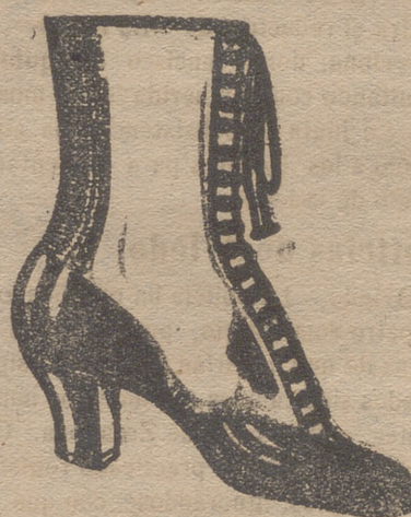
Gran surtido en todas clases, y sección económica á precios de Fábrica.

DEPOSITOS: MAQUINAS DE ESCRIBIR «MOISELESS» SILENCIOSA COMPLETAMENTE Sandalias «PACO». Para la temporada de invierno con piso de goma á precios muy económicos.