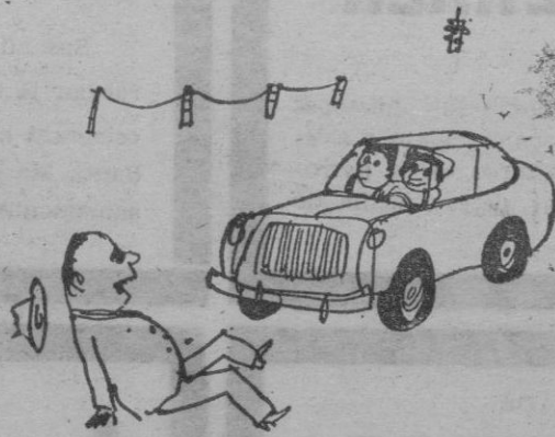
—Ya lo había dicho la echadora de cartas: que había un hombre en mi camino. (De «Tempo».)

CIENCIA.- «NO SIRVE PARA OTRA COSA QUE PARA DARNOS UNA IDEA DE LO VASTA QUE ES NUESTRA IGNORANCIA.» (La Mennais)