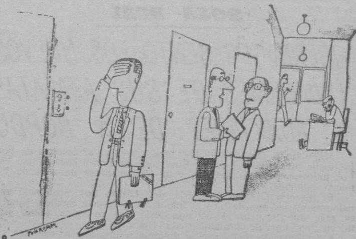
—Es el encargado del traslado de Secretos Oficiales.—

Misión rescate se llama la emisión. Probablemente, ningún título describe con más precisión de que se trata. Rescate laborioso, inteligente, cordial, entusiasta de las cosas de España. Búsqueda incesante e ininterrumpida de todo aquello que puede peligrar por desconocimiento, por inadvertencia, incluso por frivolidad. Los niños de «Misión rescate» no sólo están realizando una obra meritoria por sus efectos, sino que, ante todo, están viviendo la mejor pedagogía para ser plenamente españoles. Y casi calladamente, de la mano de esa vanguardia del futuro que son los Maestros, sin espectacularidad ninguna, con la modestia de las cosas grandes, están transmitiendo a toda la sociedad un ejemplo de como ha de vivirse la conciencia nacional; la auténtica conciencia creadora, recuperadora, cargada de fe en el ayer y en el mañana.