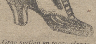
Gran surtido en todas clases, y sección económica á precios de Fábrica.

GRAN BAZAR DE CALZADO EMILIANO DOMINGO Mercado, núm. 10.