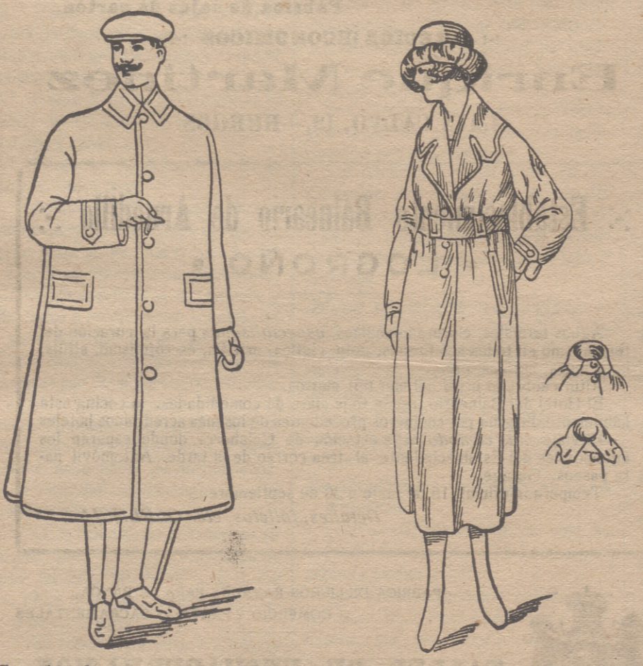
Guardapolvos de caballero, jóvenes y niños, á 9, 10, 15, 20 y 25 pts.

Casa Munguía Sesor. de REBOLLO P. Mayor 42, Lain-Calvo 9. Teléfono, núm. 88.—BURGOS.