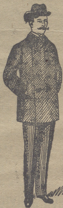
Pellicas desde 18 pesetas á 75.