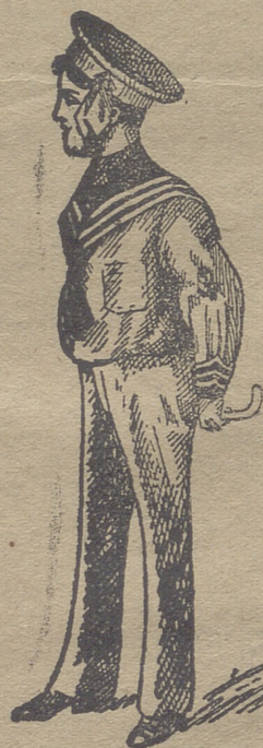
50 modelos diferentes en trajecitos de niños, en paño, vicuñas, gergas y panas. Estos dos modelos son los últimos recibidos para la temporada.