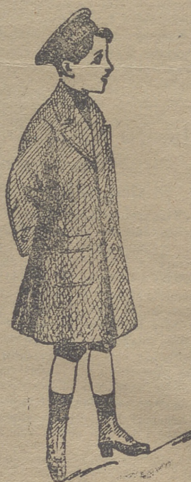
Grandes surtidos recibidos para la temporada en gabanes de jóvenes y niños