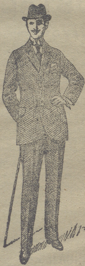
Trajes de paño de caballero y juvenil, desde 30 pesetas á 75. En pana de 25 á 60 y en dril de 20 á 35.