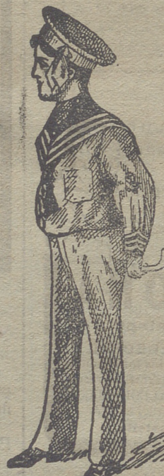
50 modelos diferentes en trajecitos de niños, en paño, vicuñas, gergas y panas. Estos dos modelos son los últimos recibidos para la temporada.