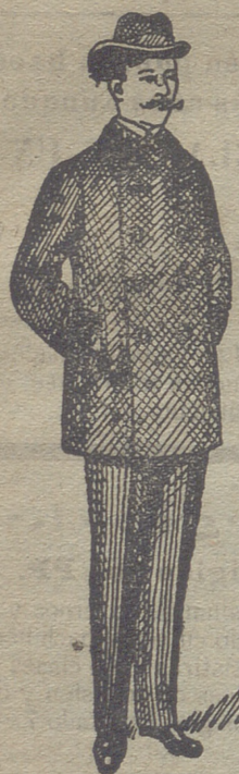
Pellizas desde 18 pesetas á 75.