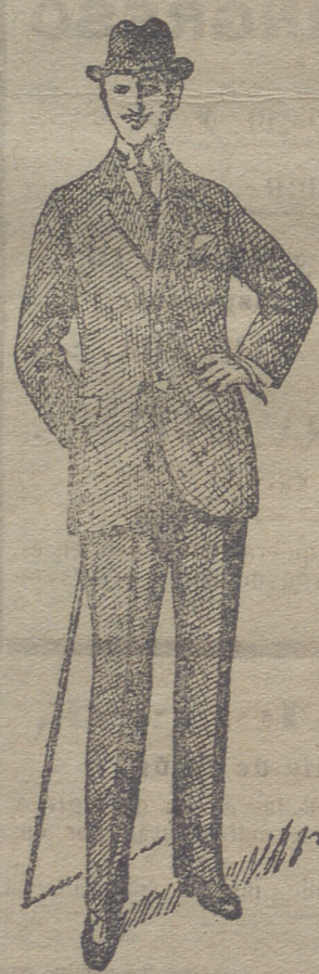
Trajes de paño de caballero y jovencito, desde 30 pesetas á 75. En pana de 25 á 60 y en dril de 20 á 35.

Agentes depositarios: IBAÑEZ Y COMPAÑIA, San Pablo, 6 y 8, BURGOS