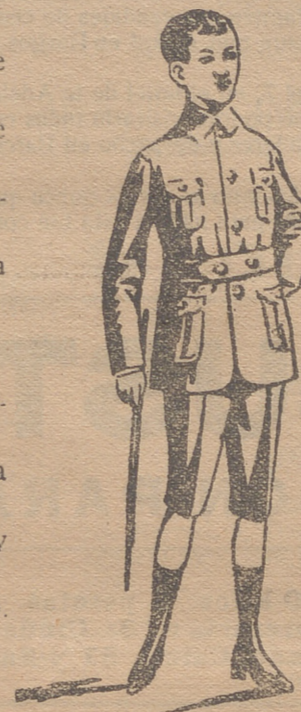
Trajecitos export y ra. forma corriente en paño, paña y drill.

En trajecitos de drill para verano se han recibido los últimos modelos de la temporada. En blanco hay bonitos modelos para la Sgda. Comunión y lazos para lo mismo.