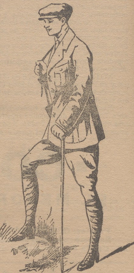
Trajes export en paño, drill y pana.

Ropa blanca de señora y niñas. Camisería, corbatería, tirantes y ligas. Grandes surtidos en lanería y pañería de caballero y señora.