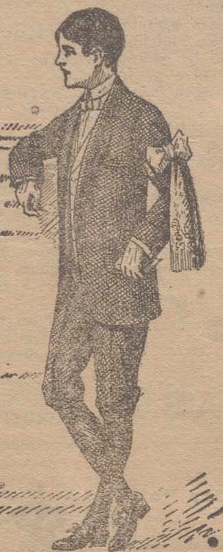
50 modelos en diferentes trajecitos de niño para primera comunión

22 modelos diferentes en abrigos de gabardina impermeabilizados. Abrigos-impermeables de señora. Capitas-impermeables de niños y niñas. Guardapolvos de caballero, señora y niño.