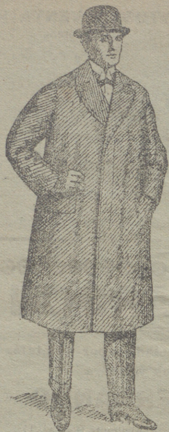
Gabanes de caballero de 30 á 125 ptas.