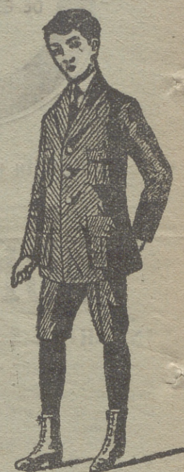
Trajes de jovencitos forma export y corriente en paño, pana y dril.

de señora y niños, corsés, medias en gasa, seda hilo y algodón, toquillas pelerinas en pelo cabra y lana. Lanería y pañería para señora, paños patentes y panas para caballero