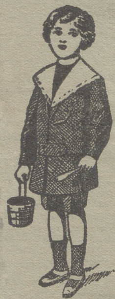
50 modelos diferentes en trajecitos de niños en paño gerga y pana.

paraguas, guantes, gorras, boinas, calcetines ligas, tirantes, cuellos cauchut, piqué y plancha.