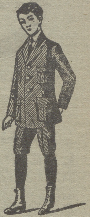
Trajes de juveni- tos forma export y corriente en paño, pana y dril.

- - La casa que más surtido presenta - -