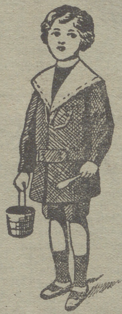
50 modelos diferentes en trajecitos de niños en paño gerga y pana.

:- Guardapolvos de caballero, señora y niños :-