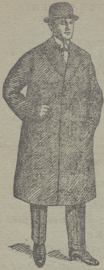
Gabanes de caballero de 30 á 125 ptas.

UNICA CASA QUE PRESENTA GRANDES SURTIDOS EN TEJIDOS Y ROPAS HECHAS DE CABALLERO SEÑORA Y NIÑO