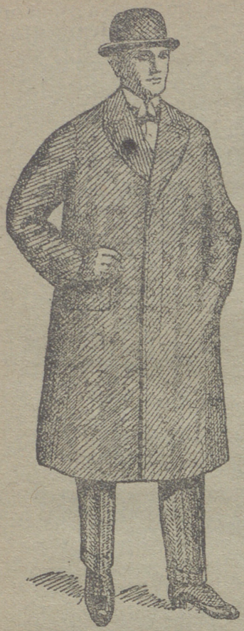
Gabares de caballero de 30 á 125 ptas.

UNICA CASA QUE PRESENTA GRANDES SURTIDOS EN TEJIDOS Y ROPAS HECHAS DE CABALLERO SEÑORA Y NIÑO