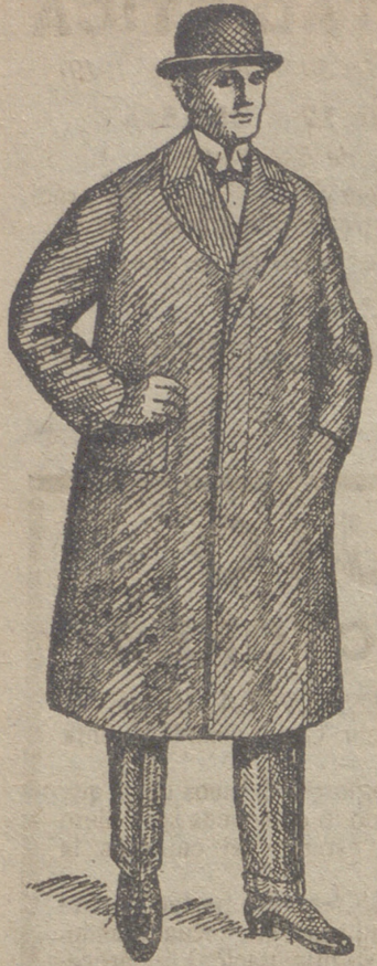
Gabanes de caballero de 30 á 125 ptas.

UNICA CASA QUE PRESENTA GRANDES SURTIDOS EN TEJIDOS Y ROPAS HECHAS DE CABALLERO SEÑORA Y NIÑO