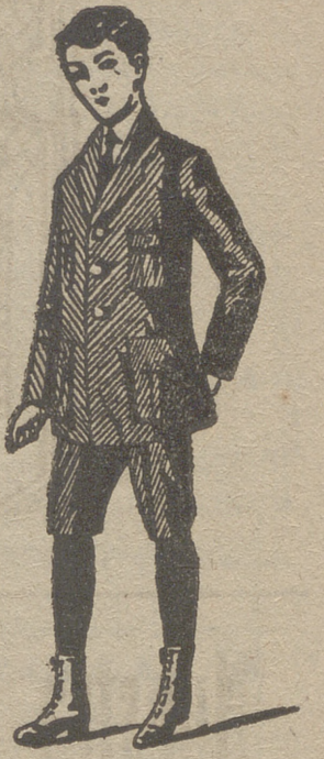
Trajes de jovencitos forma export y corriente en paño, pana y dril.

de señora y niños, corsés, medias en gasa, seda hilo y algodón, toquillas pelerinas en pelo cabra y lana. Lanería y pañería para señora, paños patentes y panas para caballero