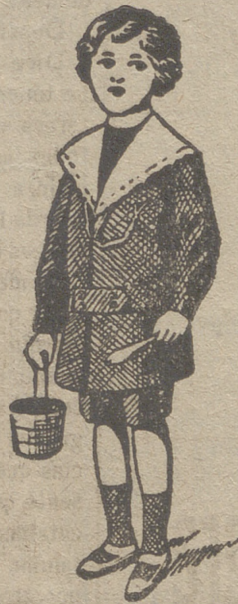
50 modelos diferentes en trajecitos de niños en paño gerga y pana.

pas, mantones, mantillas de seda, tapabocas, mantas de Palencia, género de punto paraguas, guantes, gorras, boinas, calcetines ligas, tirantes, cuellos cauchut, piqué y plancha.