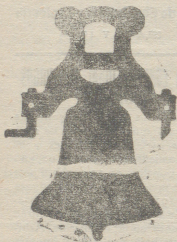
Campana con yugo de hierro de una sola pieza

Tenemos el gusto de expresar a continuación algunas de las obras realizadas en estos últimos años en Burgos y su provincia, á fin de que los que les interesa conocer esta clase de trabajos, puedan ver palpablemente la superioridad de los productos de esta casa.