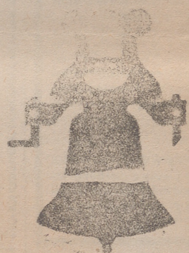
Campana con vapor de hierro de una sola pieza

Calle de Francia y Portal de Urbina. VITORIA (ALAVA)