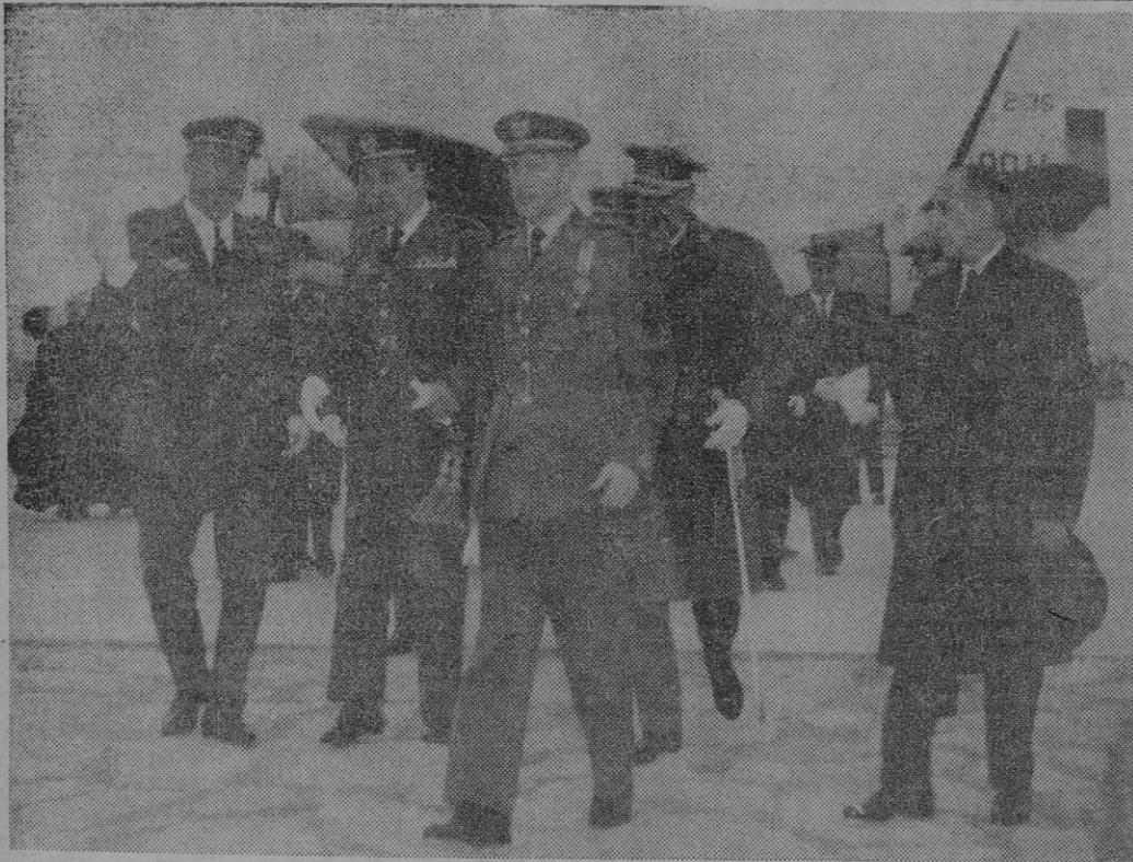
EL MINISTRO DEL AIRE, SEÑOR LACALLE LARRAGA, A SU LLEGADA AL AEROPUERTO DE SON SAN JUAN, FUE RECIBIDO POR NUESTRAS PRIMERAS AUTORIDADES MILITARES Y CIVILES.