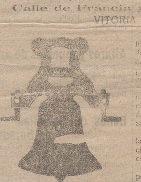
Campana con yugo de hierro de una sola pieza

Esta antigua y acreditada fábrica se halla dotada de maquinaria la más moderna que se conoce y de la mayor precisión, movida por motores eléctricos para la construcción de relojes públicos de todas clases.