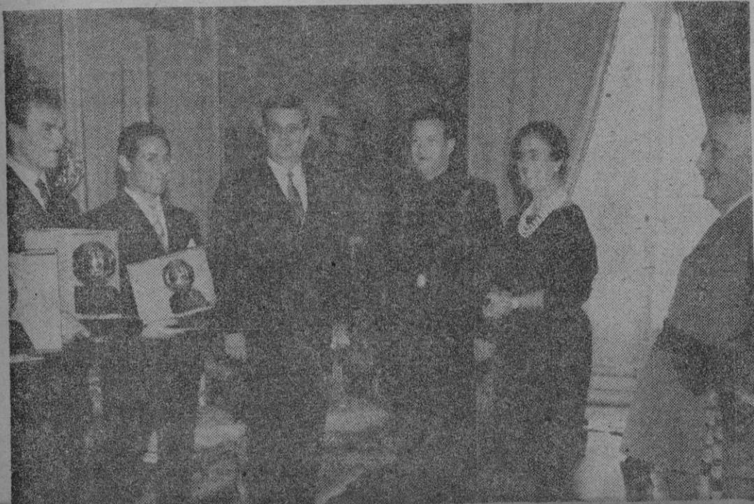
Madrid. — Doña Carmen Polo de Franco, en presencia de S.E. el Jefe del Estado, del Gobernador Civil de Madrid y de otras personalidades, durante el acto de entrega de los balones de plata concedidos a los jugadores, Di Stefano y Gento por el Real Madrid y Kubala y Araquistain, por la Selección Nacional, en el partido de homenaje al Pentacampeón y a beneficio de la Campaña para la construcción de viviendas para la necesidad, patrocinado por la Ilustre dama.

La esposa del Caudillo entrega los balones de plata a los jugadores más destacados en el partido de homenaje al Real Madrid