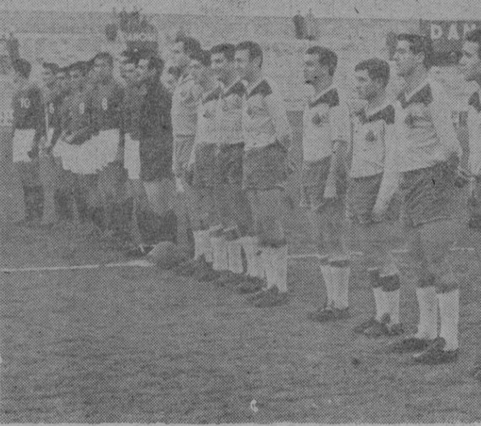
Los equipos mallorquín y chileno, alineados en el centro del campo, escuchan la interpretación de los himnos nacionales de Chile y España.