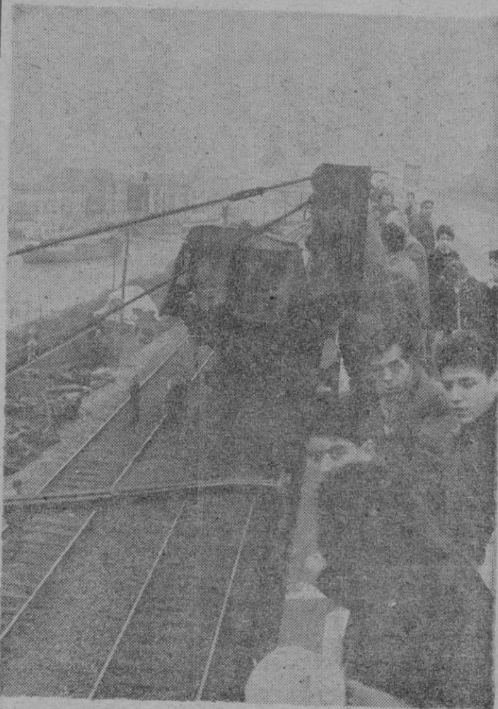
BILBAO. — A la entrada de la estación de Zorroza, un tren de viajeros que salía de Bilbao chocó con un mercancías que se hallaba parado. La máquina del primero saltó por encima del último vagón del convoy de mercancías, que quedó tal como aparece en la foto. Hubo diecinueve heridos, en su mayoría leves.