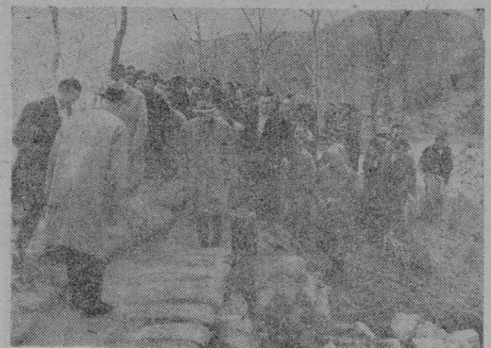
Tudela. — El Ministro de Obras Públicas General Vigón, acompañado de las autoridades provinciales, visitó detenidamente las zonas más afectadas por las recientes crecidas del Ebro. En la foto: El ministro recorre uno de los lugares afectados por la inundación.