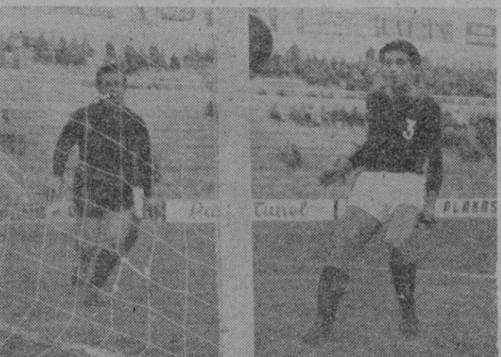
Aun cuando parezca que es gol, no lo fue. El balón disparado contra la meta chilena, parecía que iba a entrar, pero en su camino encontró el poste y terminó siendo despejada la pelota por el defensa que aparece en primer término.

Ayer, en nuestra edición decíamos que iba a jugar Amancio, porque creíamos que a estas alturas si alguien tenía que venir a resolver una situación delicada sería un elemento así, de relieve. Amancio nos parecía un nombre (Viene de la página anterior)