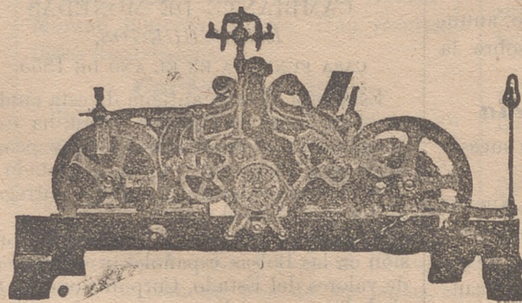
Reloj de ocho días de cuerda tocando horas con repetición y medias