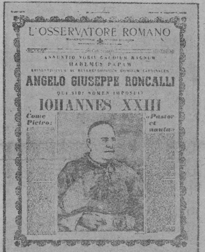
Con las palabras del anuncio oficial de haber sido elegido Pontífice de la Iglesia, hecho por el Cardenal Caccia desde el balcón central de la basílica de San Pedro, encabeza el «Osservatore Romano» su primera plana que va presidida con el retrato de Juan XXIII.

Esto no hace sino resaltar la recia personalidad humana del actual Jefe Supremo de la Iglesia, en torno al cual se cuentan ya anécdotas muy significativas. Al parecer su afabilidad, envuelta en un suave matiz de agradable humorismo, es extraño diría. Basten unos ejemplos. Al romper la norma tradicional por la cual el conclave se prolongó una hora más después de la elección, algunos dignatarios y empleados del Palacio Apostólico, se apresuraron a irrumpir en las dependencias del recinto. Incluso antes de que el Papa hubiera aparecido en el balcón de la Basílica de San Pedro. Su Santidad en persona se dirigió a los impacientes en tono de broma, mientras ellos se arrodillaban: «Habéis incurrido en excomunión, pero yo recurriré a mi