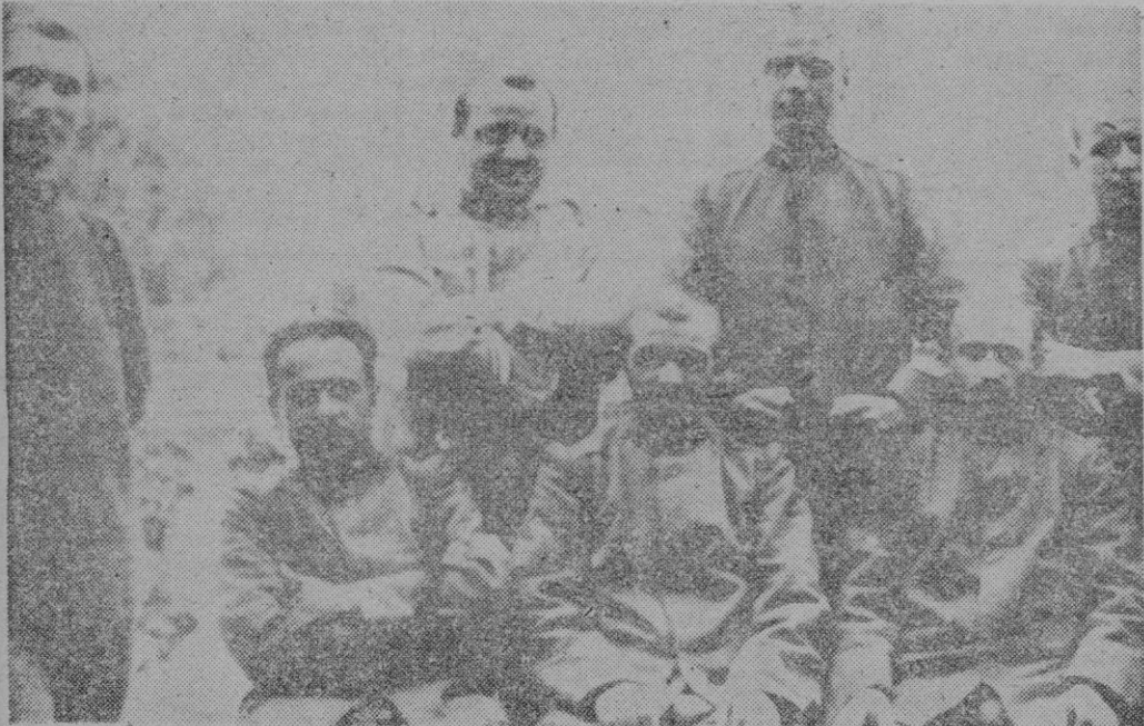
S. S. Juan XXIII, de pie y segundo por la izquierda, durante la primera guerra mundial en su calidad de capellán del Ejército italiano.