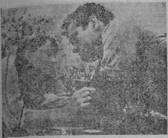
Una escena de «Al este del Edén»

Nacionalidad: nort.americana Proyección: Sala Augusta. Con ocasión del X aniversario de su fundación, la Sala Augusta ha seleccionado una de las más importantes realizaciones norteamericanas de estos días, es decir «Al este del Edén», inspirada en la conocida novela —de igual título— del «duro» John Steinbeck.