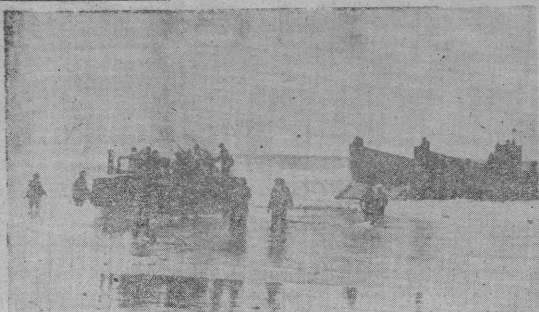
San Fernando. — Un momento del desembarco durante la fase correspondiente al ejercicio «Tigres», efectuado en presencia del Ministro de Marina, Almirante Abarzuza, en el sector de costa inmediato al lugar conocido por «Corral de Viveo»