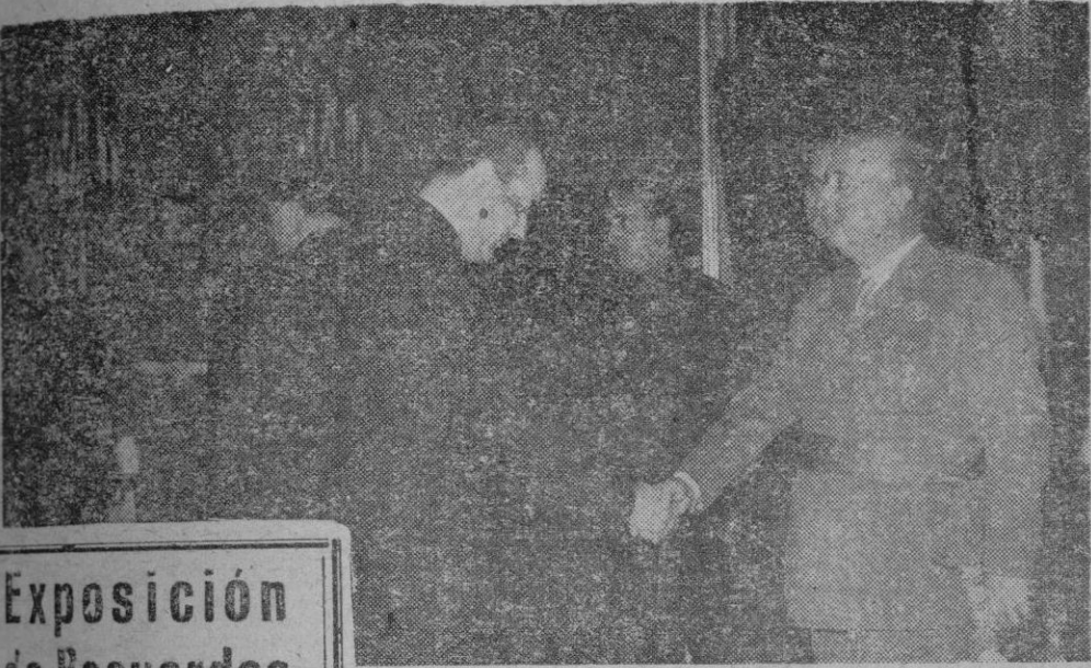
Madrid. — S. E. el Jefe del Estado durante la audiencia concedida a los mandos nacionales del Movimiento, acompañados del Ministro Secretario, señor Solís, y Vicesecretario señor Jiménez Millas.