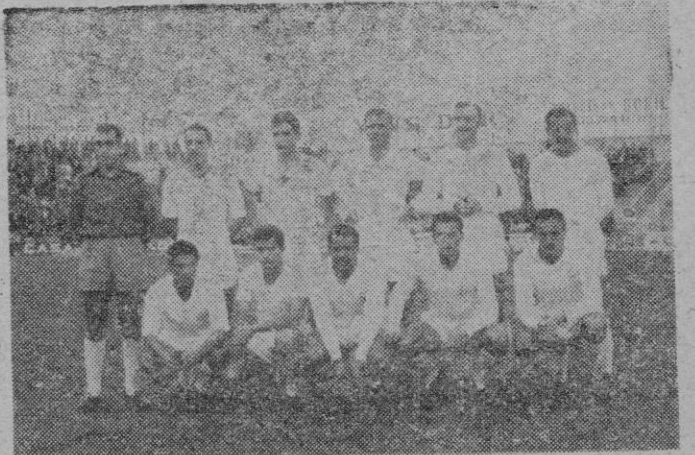
Equipo presentado por el «Real Madrid» durante el primer tiempo del partido.