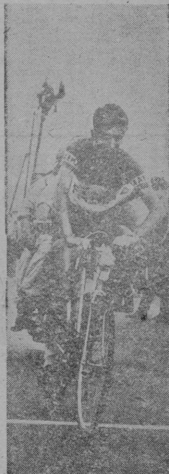
BAHAMONTES rey de la montaña

Por San Cristóbal de la Vega a 107 kilómetros de Palencia, pasan los corredores en un solo paquete a las 10:45 de la mañana. Formando un solo grupo pasan los corredores por Montuenga a las 10:56 de la mañana, con 47 minutos de retraso. Van recorridos 111 kilómetros. Casi siempre son los corredores galos los que con más espíritu de equipo se relevan en el mando del grupo con gran precisión. El retraso aumentó y solo queda la esperanza de que una vez escalado el Alto de los Leones ya en el descenso hacia Madrid los ciclistas recuperen algo del tiempo perdido. Es en la bajada de este puerto donde probablemente se entablará la lucha, no solamente con la pretensión de ganar la etapa sino obtener una mejor clasificación final. Se mantienen las mismas posiciones al paso por Sanchidrián a 129 kilómetros de Palencia. Al entrar en ella pinchó el francés Grezye.