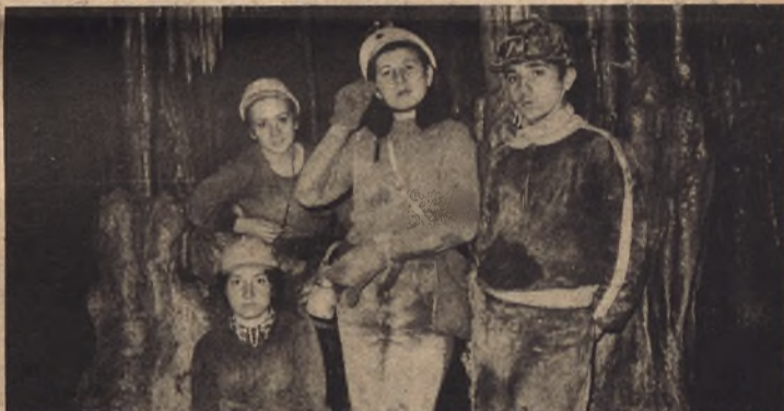
Un grupo de jóvenes espeleólogos en su visita a la Sima del Muerto, en Ricla

● LA SILENCIOSA Y ENCOMIABLE LABOR DEL GRUPO "KIRCHER"