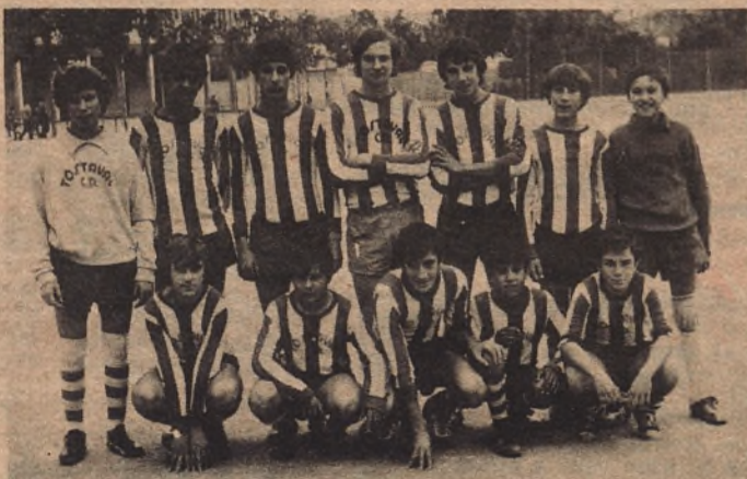
TOSTAVAL, equipo revelación del Grupo III

Si observamos detenidamente lo realizado hasta la fecha en la competición infantil, veremos que se está desarrollando con la más absoluta normalidad. Todos los pronósticos por mí realizados antes de comenzar el campeonato, en los que designaba a priori a los futuros campeones de grupo y que dieron bastante que hablar entre los técnicos por considerarlos demasiado prematuros, se han cumplido en su totalidad, no sé si al final que es cuando deben ser definitivos, éstos equipos seguirán mandando en sus respectivos grupos, pero lo cierto es que buena parte del