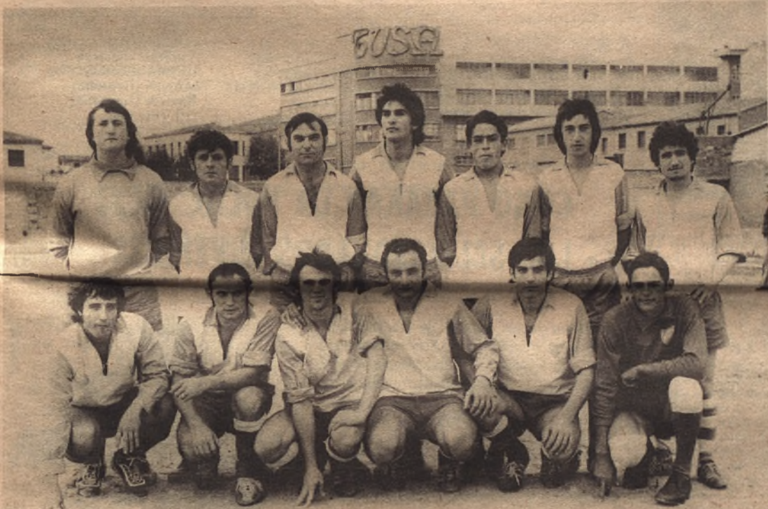
FOCAR (Segunda Regional)

"EL EQUIPO ESTA PREPARADO PARA EL ASCENSO"