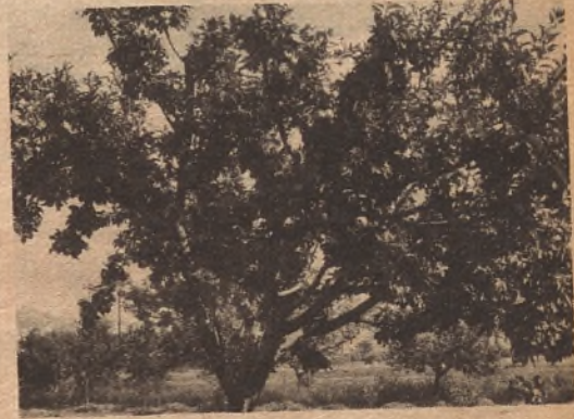
...manzanas, manzanitas famosas de Calatayud, que ya fueron cantadas en versos latinos por el primer poeta ibero...

En su irremediable mutis del paisaje la ciruela parece ser acompañada por el membrillo. El membrillo, como saben ustedes y el Diccionario, es un fruto amarillo, muy aromático, de carne ácida y áspera. A veces es también algún personaje a quien llamamos así por no hacerlo más rotundamente. Pero en toda la comarca su utilidad apenas ha residido en la que solían darle los arcones de ropa blanca de nuestras señoriales abuelas. A veces, eso sí, llega a ciertas mesas en bloques compactos similares al mostillo, aunque el desconcierto industrial al uso hace temer a más de un receloso consumidor que en su gualda manipulación