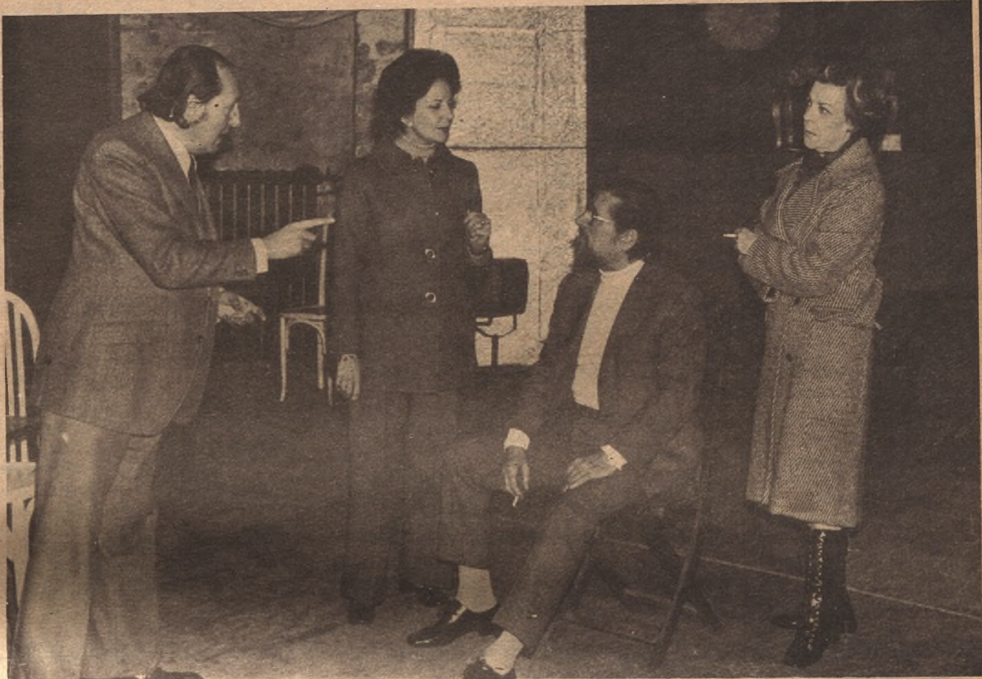
De izquierda a derecha: el director Miguel Frank; Conchita Montes, Enrique Diosdado y Amelia de la Torre.