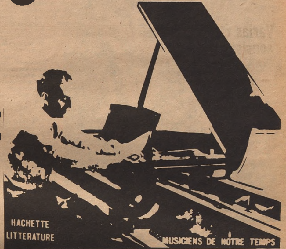
Portada de "Gershwin", obra de André Gauthier, publicada recientemente en Paris por la Librería Hachette, en su colección "Músicos de nuestro tiempo".