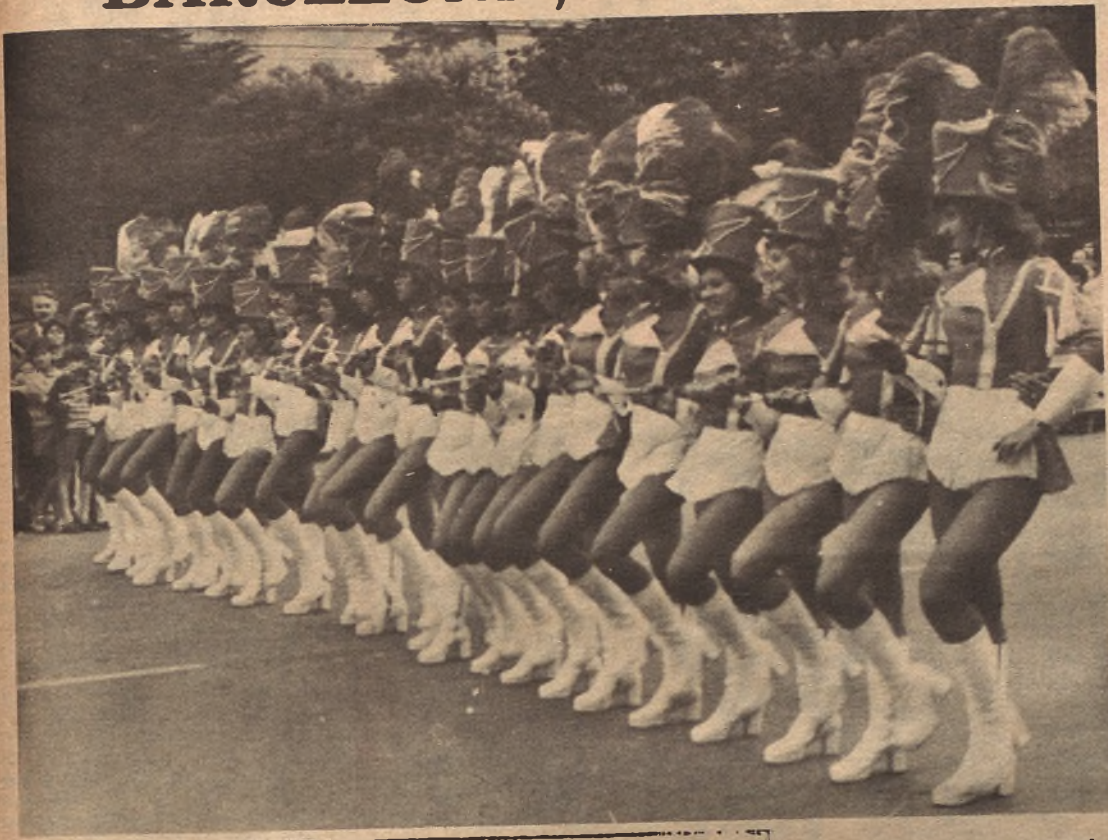
BARCELONA. - Un aspecto de la Cabalgata de la Merced. Se celebra en la Avenida de María Cristina, en el recinto ferial, con participación de carrozas, bandas de música de diversos países, "majorettes" y otras atracciones