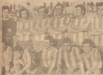
Una reciente foto del Monzón, el equipo que el pasado domingo defendió bravamente sus posibilidades ante nuestro equipo.

● PARA CONTENDER CON EL ARAGON, SE DESPLAZA EL FRAGA A ZARAGOZA