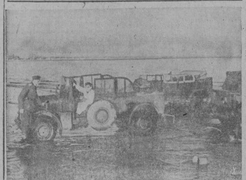
En las costas del mar de Azov, soldados alemanes limpiaban sus coches que han realizado una larga marcha.

Tokio, 9.—El Gobierno japonés ha decidido la creación de un tribunal de presas.—EFE.