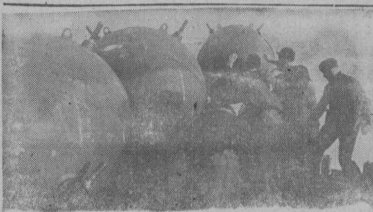
Colocación de minas alemanas en el golfo de Finlandia contra la navegación soviética.