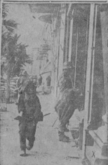
La ciudad de Jalta, en Crimea, recorrida por patrullas alemanas

Así lo hace saber un aviso oficial de Washington