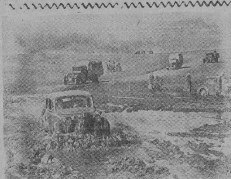
Una columna motorizada de la SS. alemana salva las dificultades del terreno ruso convertido por las grandes lluvias en barrizales semi-pantanosos

El embajador en la Santa Sede, Sr. Yanguas Messia, colocó al pie del monumento un magnífico jarrón de flores con los colores de la bandera española.—EFE.