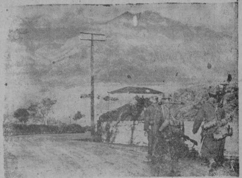
Patrulla de reconocimiento alemana, entrando en una aldea de las montañas de Jalta, en Crimea.