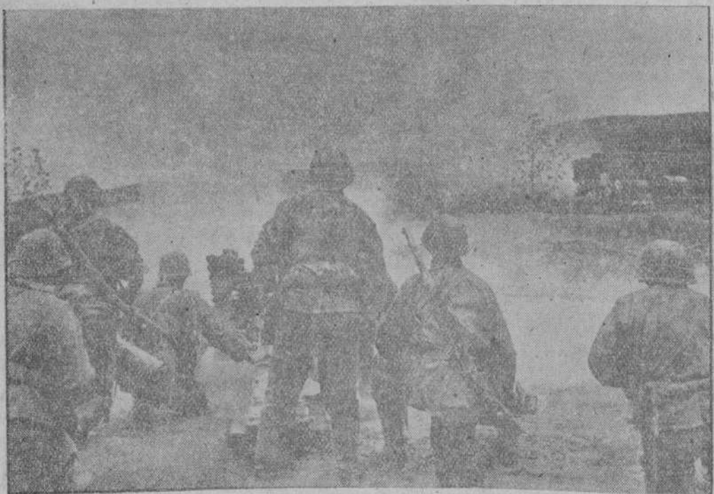
Un pueblo ruso, desde el cual un grupo de francotiradores tiroteó a las columnas alemanas a su paso, es aniquilado totalmente, conforme a la ley marcial

6.º--Se depositará sin franqueo.--(Cifra).