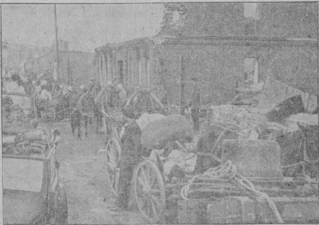
Habitantes de Smolensko regresan a la ciudad después de su toma por las fuerzas alemanas

Vichy, 29.—La vicepresidencia del Consejo de Ministros francés será desempeñada por el ministro de Estado Romier, durante la ausencia del almirante Darlan, que abandonó Vichy para ir a descansar unos días en su tierra natal.—EFE.