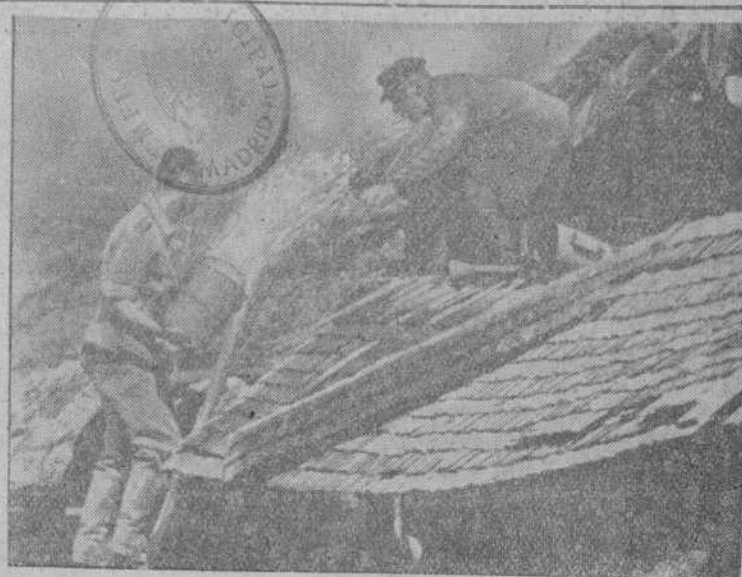
Soldados alemanes colaboran en la extinción de los incendios en una aldea rusa, abandonada precipitadamente por los rojos.

Ayer la aviación atacó los objetivos militares de importancia y localidades soviéticas situadas en la península de Kola. Grandes fábricas y talleres fueron alcanzados. EFE.