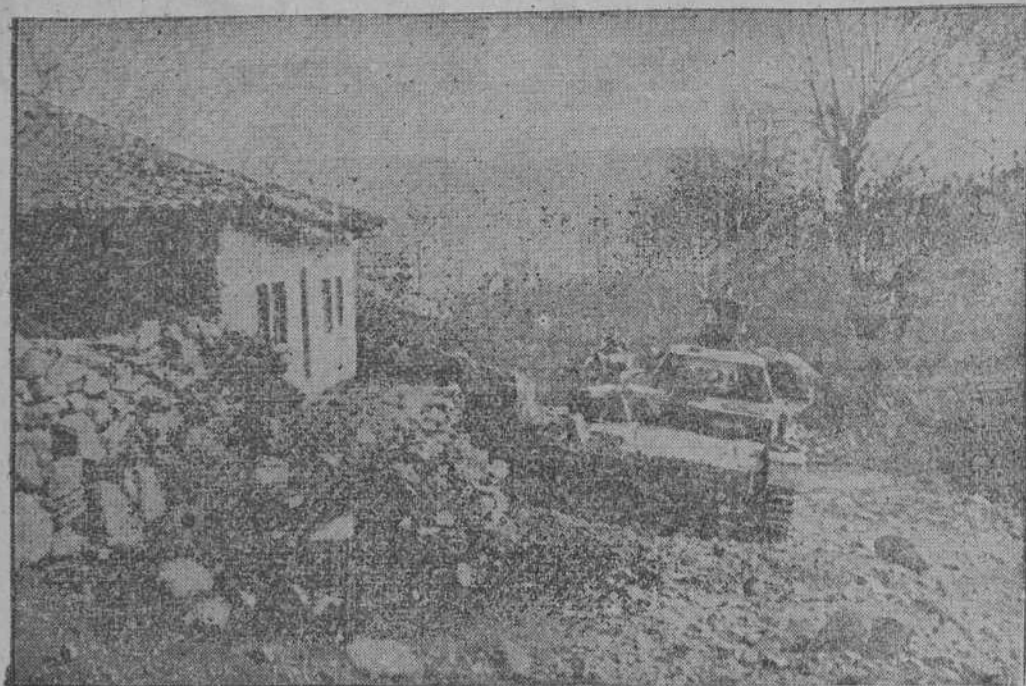
Avance de los tanques alemanes por el accidentado suelo griego