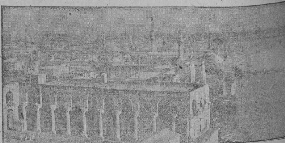
Vista de Bagdad capital del Irak, sobre la que lanzaron los aviones ingleses proclamas amenazando con el bombardeo de la ciudad si no se rendían

Berlín, 24.—El Episcopado alemán ha dirigido un mensaje a todos los sacerdotes, en el que se declara que la guerra contra la U.R.S.S. es una lucha en pro del cristianismo del mundo entero. En los medios católicos se anuncia que es posible que el Episcopado dirija un mensaje al Führer, en el que se afirma que la Iglesia Católica alemana participará con entusiasmo en la gigantesca lucha contra el comunismo.—Efe.