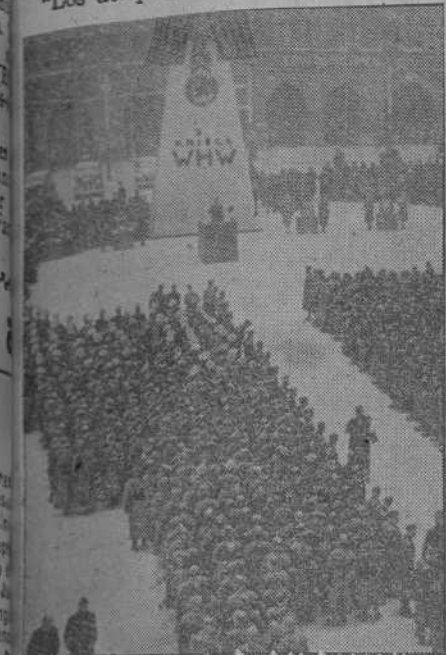
En una plaza de Praga se inauguró un gran monumento recordatorio del Auxilio de Invierno alemán.

Berlín, 21.—En su ampliación al parte oficial, la Agencia N. B. dice: "Los ataques aéreos alemanes se concentraron durante la noche última sobre Plymouth, que es, después de Portsmouth la base naval más importante del sureste de Inglaterra. Las condiciones de visibilidad hicieron que las escuadrillas se presentaran en formaciones muy nutridas. Los objetivos militares fueron alcanzados eficazmente por multitud de bombas, que provocaron un verdadero mar de llamas en cuatro kilómetros de extensión. Los arsenales e instalaciones quedaron reducidos a ruinas y el depósito principal de la marina de guerra enemiga fué transformado en un inmenso brasero. Las explosiones producidas permiten suponer que el ataque hizo blanco en