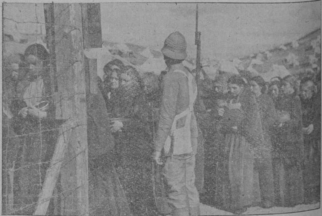
Escena de la gran película "Ohm Krüger" que recoge un aspecto de la vida en un campo de concentración inglés durante la tristemente célebre guerra de los boers en África del Sur.

Buenos Aires, 21.—Dos aviones y dos suboficiales resultaron muertos en un accidente de aviación ocurrido durante las maniobras del Ejército argentino. Las autoridades han abierto una investigación para averiguar el ocurrido.—EFE.