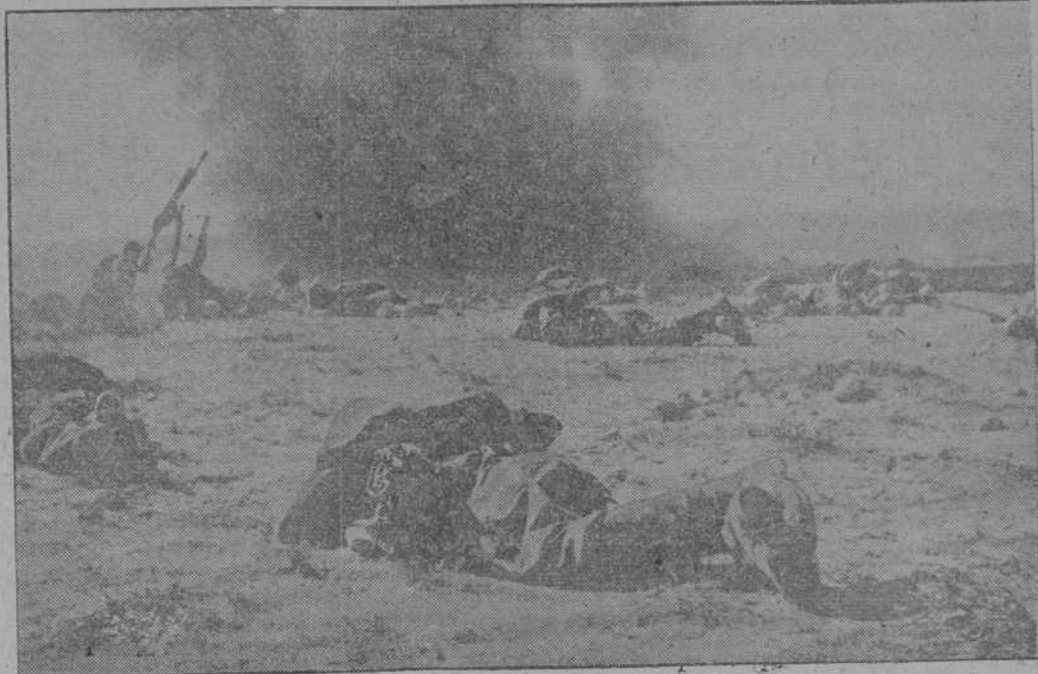
Una columna italiana es sorprendida en pleno desierto líbico por aviones enemigos. El terreno ofrece poca protección a los soldados; pero los servicios antiaéreos rechazan impasibles el ataque.