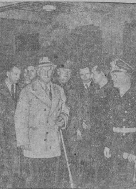
Von Papen, embajador del Reich en Turquía, llega a Constanza.

Berlín, 15.—Comunicado del alto mando de las fuerzas armadas alemanas: