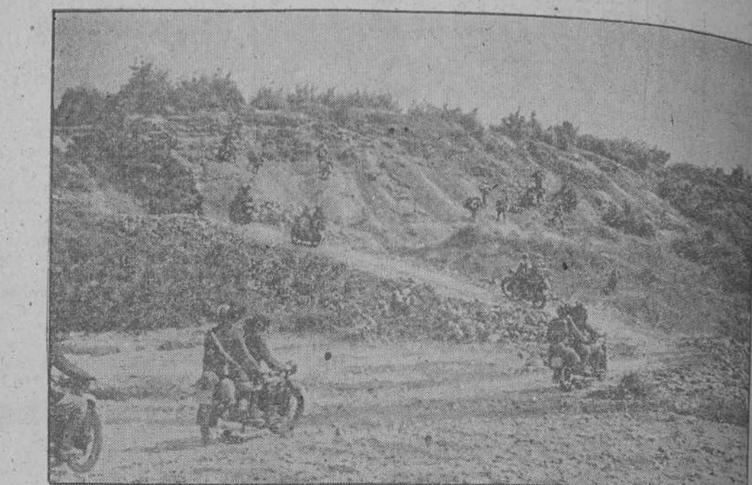
Las tropas italianas operan en terreno muy accidentado, falto de carreteras y núcleos urbanos. He aquí un destacamento de Bersaglieri ocupando una posición en territorio fronterizo de Grecia.

VIMOS VALTRY PRODUCCION ESPAÑOLA Insuperable